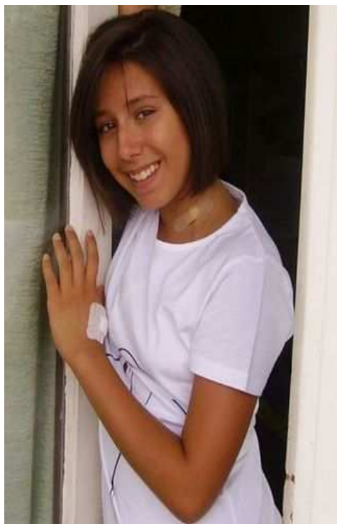
Veglia di Natale 2011 La Fede è Speranza